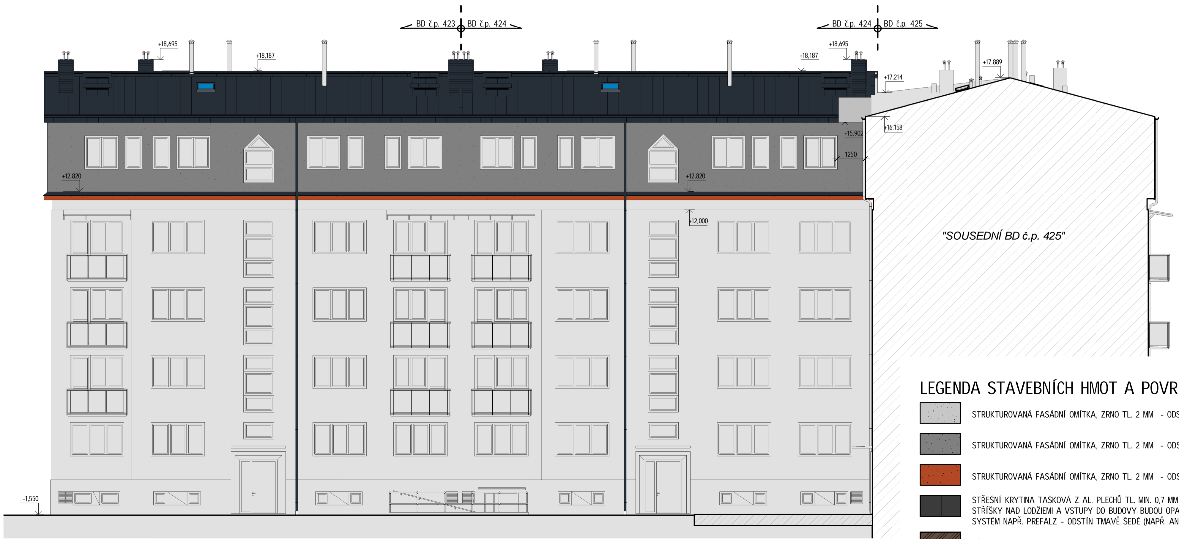
3 N_Pohled zadní 1 : 100