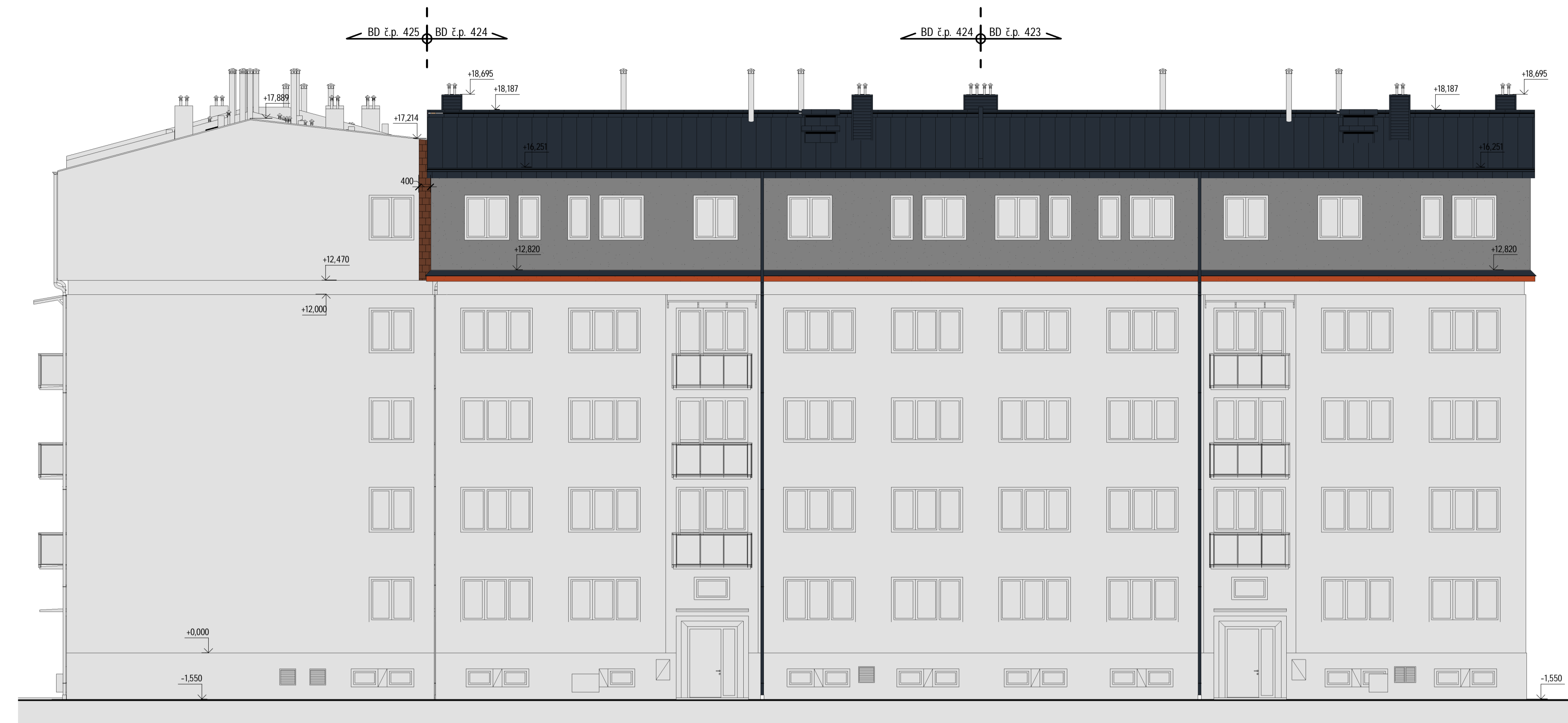
1 N_Pohled přední 1 : 100