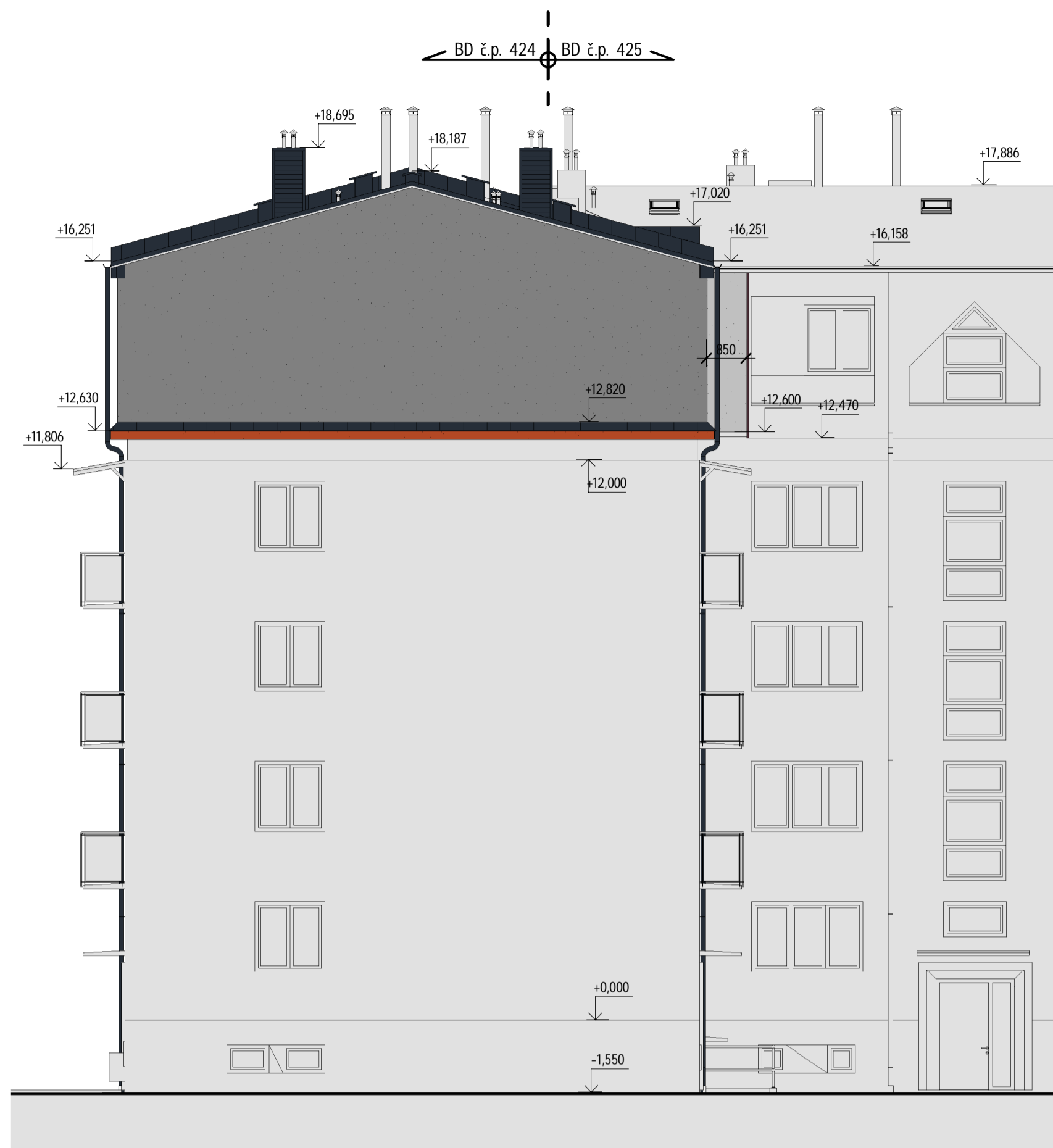
4 N_Pohled pravý 1 : 100

NOVĚ NAVRŽENÉ KLEMPÍŘSKÉ PRVKY BUDOU PROVEDENY Z AL. PLECHŮ S POVRCHOVOU ÚPRAVOU TL. MIN. 0,7 MM - NAPŘ. ODSTÍN TMAVÉ ŠEDÉ ANTRACIT (RAL 7016)